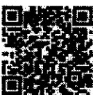
๑. รายการเครื่องมือ ทีม SEhRT