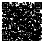
๒. โปรแกรมเทียบมาตรฐาน คุณภาพน้ำ