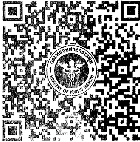
QR Code >> คำแนะนำสำหรับผู้นิพนธ์