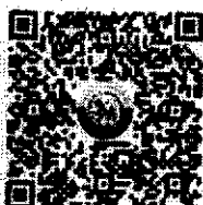
สรุปข้อมูลการขยายระยะดำเนินการ ณ วันที่ ๑๐ กันยายน ๒๕๖๓