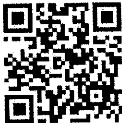
QR Code ๑ ยืนยันการเข้าร่วมฝึกอบรม