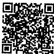
Line @ งานสัมมนา