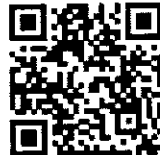
รุ่นที่ ๒ (Zoom)