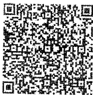
สิ่งที่ส่งมาด้วย

กองบริหารงานท้องถิ่น กลุ่มงานวิชาการและวิจัยเพื่อการพัฒนาท้องถิ่น โทร. ๐ ๒๒๔๓ ๔๐๐๐ ต่อ ๒๒๑๒ โทรสาร ๐ ๒๒๔๓ ๑๘๑๒ ไปรษณีย์อิเล็กทรอนิกส์ saraban@dla.go.th