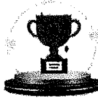
รางวัลรองชนะเลิศอันดับ 2

โลรางวัลจากรัฐมนตรีว่าการ กระทรวงมหาดไทย