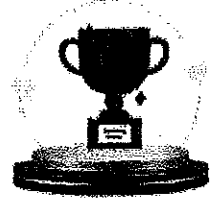
รางวัลชมเชย