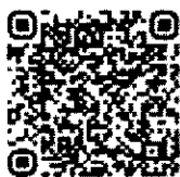
QR Code สิ่งที่มาด้วย ๑

รายงานการวิจัยฉบับสมบูรณ์ รูปแบบการจัดการเรียนรู้ที่เสริมสร้าง ทักษะการเรียนรู้แบบนำตนเองเชิง สร้างสรรค์