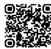
QR Code สิ่งที่มาด้วย ๓

วีดิทัศน์การเรียนการสอน แบบนำตนเองเชิงสร้างสรรค์