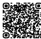
QR Code สิ่งที่มาด้วย ๒

เอกสาร รูปแบบการจัดการเรียนรู้ ที่เสริมสร้างทักษะการเรียนรู้แบบ นำตนเองเชิงสร้างสรรค์