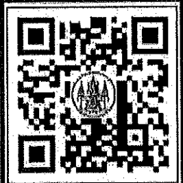
ดาวน์โหลดใบสมัคร