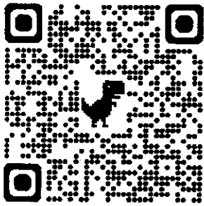
QR Code ใบสมัคร

กรอกใบสมัครการอบรมได้จาก QR-Code นี้ หรือลิงก์ https://forms.gle/4kjNi52ER4Bhq1Fx8