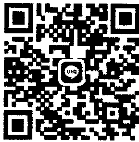
ไลน์กลุ่มการอบรม