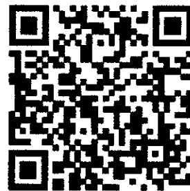
QR Code โครงการ